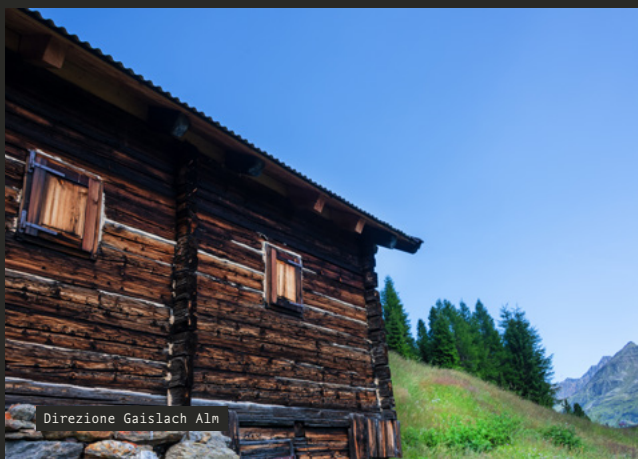
Direzione Gaislach Alm