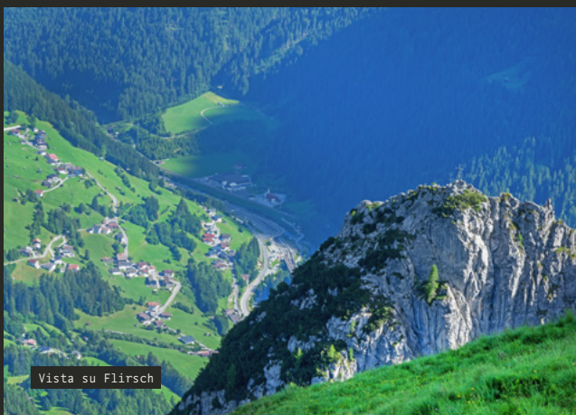
Vista su Flirsch