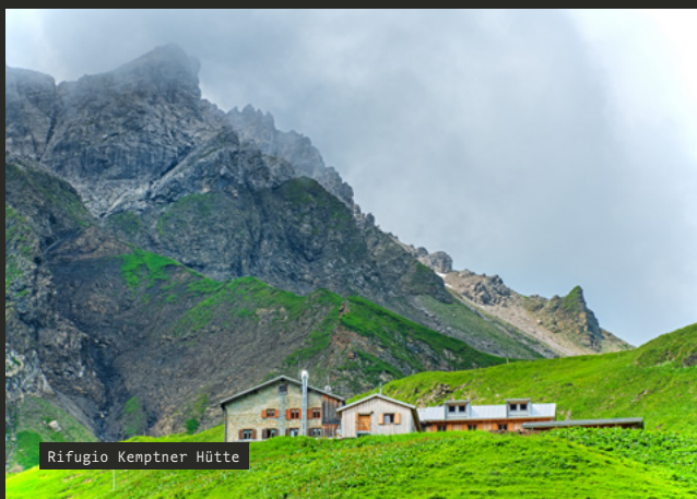
Rifugio Kemptner Hütte